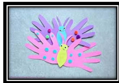
emprunts de mains