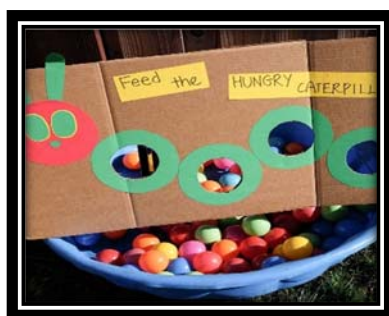
créer un jeu