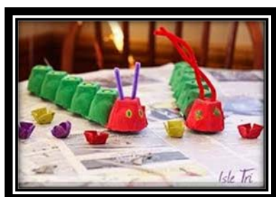
chenilles en carton

Voici des activités dont vous pouvez ajouter à l'histoire :